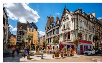
Ljubljana 7. 9.